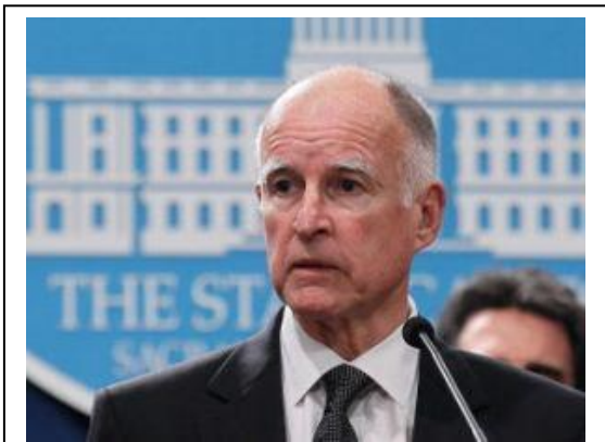
California Governor Jerry Brown