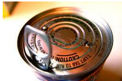
The lining inside most food and beverage cans contains bisphenol A that is a source of exposure for people of all ages.

The DNA epigenetic marks were altered on certain genes in the adult rats. Specifically, two genes that provide directions to build two forms of estrogen receptors – a process called encoding – were affected. The BPA treatment increased the frequency of methyl groups – known as hypermethylation – attached to specific DNA codes in the promoter regions of the